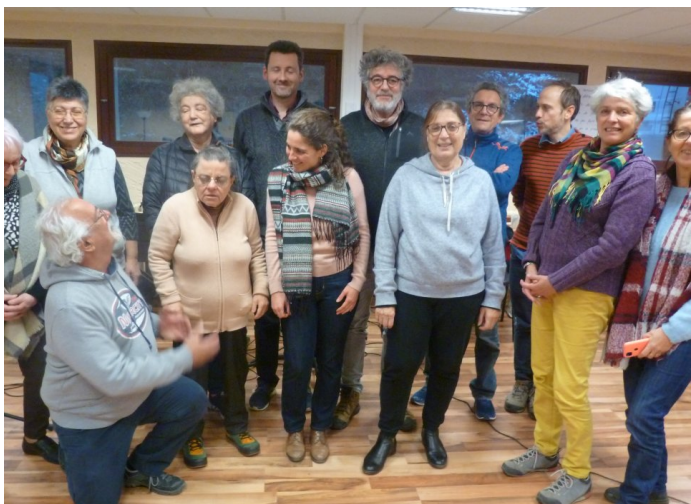
Première résidence artistique